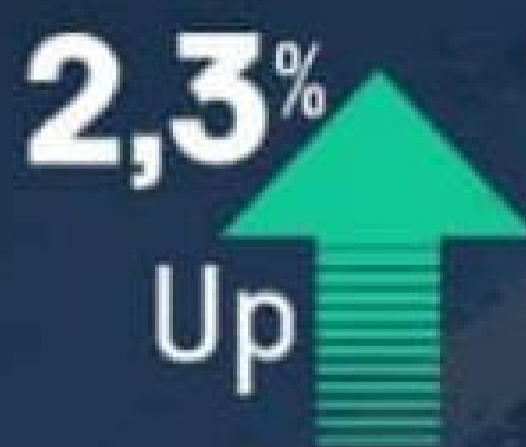
Occupied Room Nights (ORN)